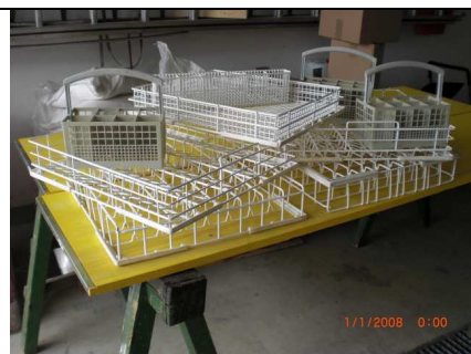
5 Körbe groß, 1 Besteckeinsatz, 3 Besteckkörbe(grau)