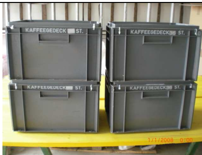
Kaffeegedecke: 4 Kisten á 36 St.