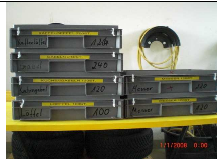
2 Kisten Messer á 120 St. 1 Kiste Gabeln á 240 St. 1 Kiste Löffel á 100 St. 1 Kiste Kaffeelöffel á 200 St. 1 Kiste Kuchengabel á 120 St.