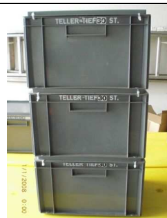
Teller tief: 3 Kisten á 30 St.