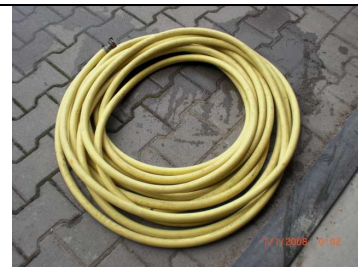
Zulaufschlauch ca. 20m