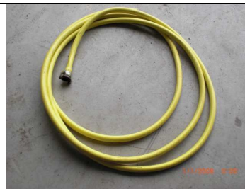
2 Ablaufschläuche (ca. 6 u. 7 m)