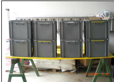
Teller flach: 8 Kisten á 28 St.