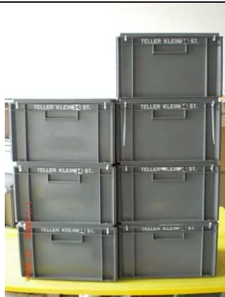
Teller klein: 7 Kisten á 34 St.