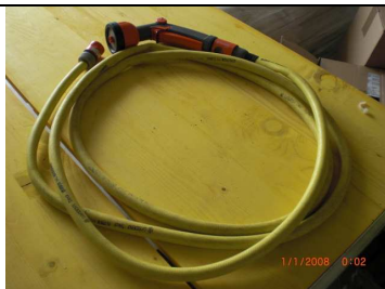
1 Schlauch mit Brause